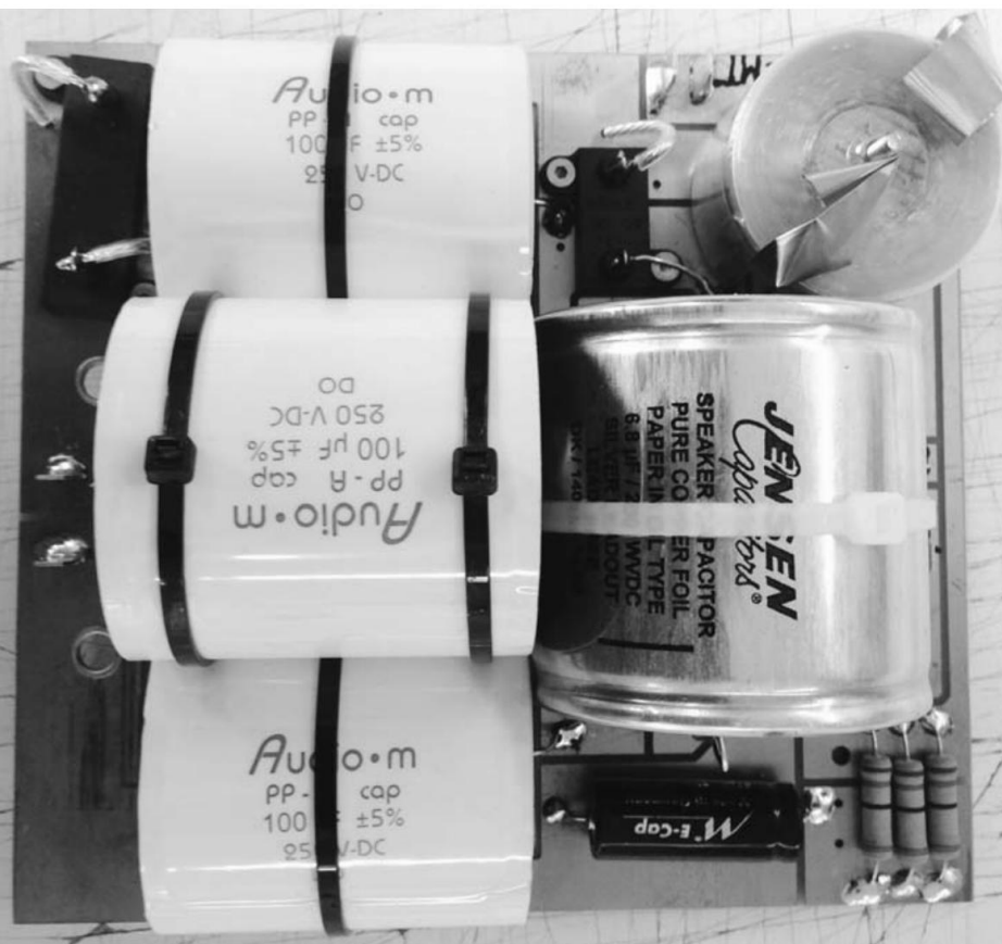
Najlepsze komponenty na Crossover, taki jak Kondensator papierowy olejowy Jensen - sator-

Niektóre z legendarnych nagrań, takie jak dwa nagrania Normy -